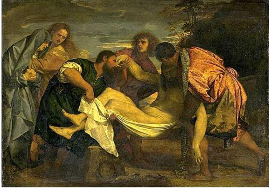
تیسیانو / Ticiano